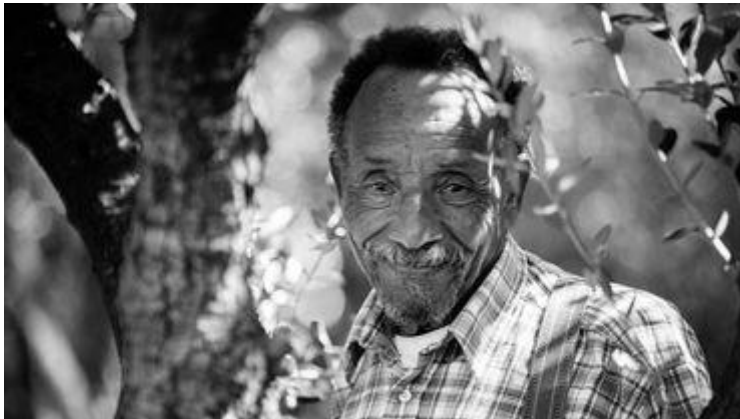
Pierre Rabhi